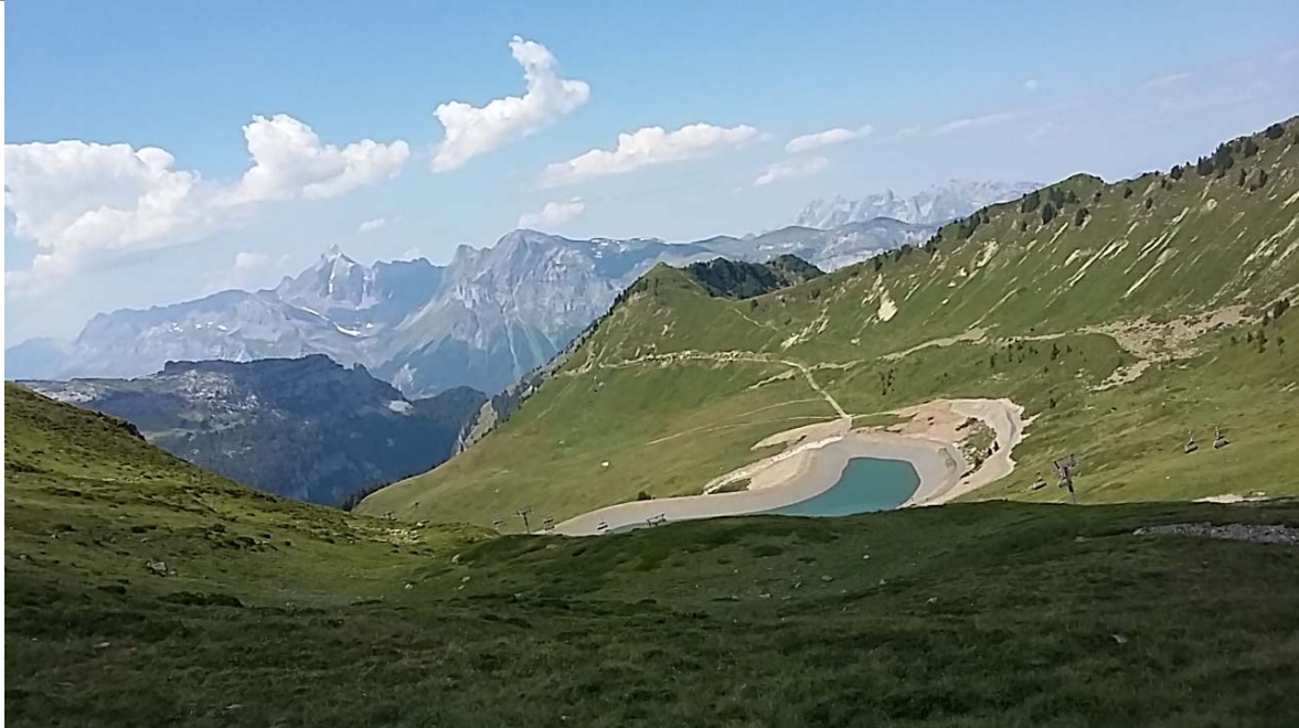
Retenue collinaire à Flaine

- Perte de la « Rivière Enverse » , accessible pour tous à pied depuis le bus.