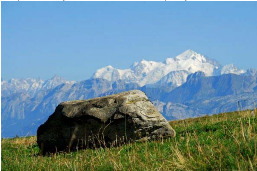
Bloc erratique